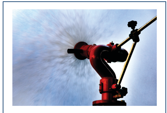
آزمون اندازه گیری میزان ریزش آب از نازل Measuring the nozzle water drop test